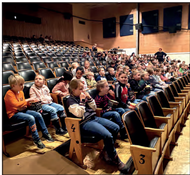
Žáci mšecké školy ve stochovském kině.