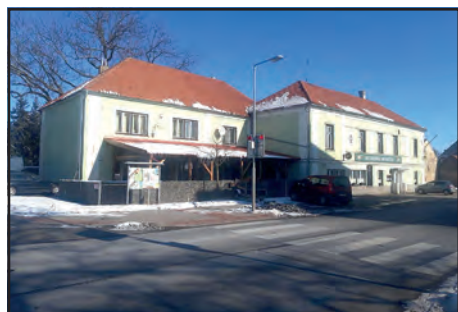
Budova restaurace Na Knížecí by měla být také zateplena a opatřena novou fasádou.