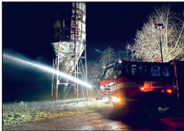
Nové zásahové vozidlo disponuje velmi dobrými světly, která jsou pro časté noční zásahy nezbytná.

Za část vybavení jsme velice spokojeni a naše očekávání bylo potvrzeno během školení, cvičení a zásahů, které jsme doposud s vozem absolvovali. K vybavení vozu máme jen jednu výtku, a tou je systém uvolnění bubny s vysokotlakou hadicí. Tento systém nyní neumožňuje rozvinutí proudy bez pomoci druhého hasiče. Skutečnost jsme nahlásili výrobci a ten začal požadavek na změnu /opravu řešit.