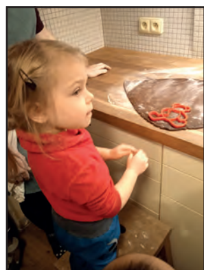
Děti si vykrajovaly perníčky.