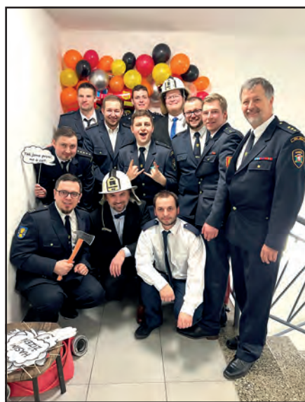
Skupinové foto mšeckých a třtických hasičů.