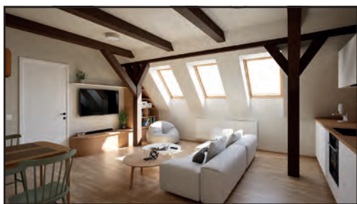
I takto by mohly vypadat vnitřní prostory v podkrovní bývalého chléva.

S památkáři jsme to již po samotném zřícení střechy kon-