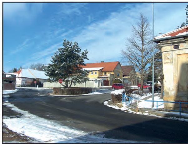
Zelená náves ve Mšeci by se letos měla výrazně proměnit.