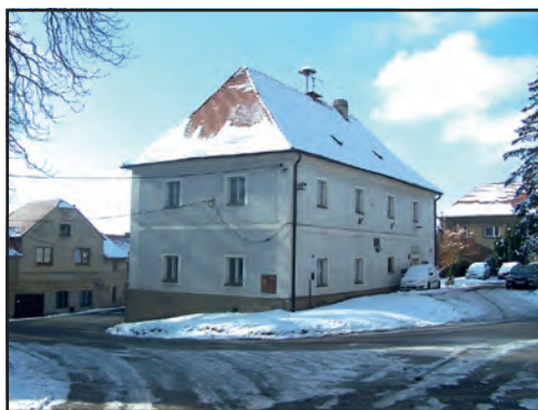
Kdy se na této budově objeví lešení?

Na středisko bychom měli čerpat dotaci ve výši 5,7 mil. Kč a na úřad 4,9 mil. Kč. Jedná se o tzv. 100% dotace, kdy jsou rozpočtovány jednotlivé položky dle ceníku poskytovatele dotace. Pokud se do tohoto ceníku vejde, nebudeme doplácet ani korunu. Takže pevně věřím, že je ceník nastaven