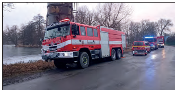
Nová Tatra Terra u Červeného rybníka.

Nedokážeme posoudit, zda úroveň vozidla je zohledně-