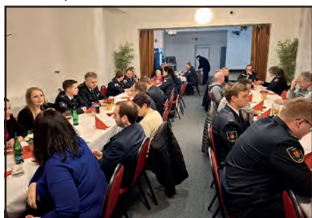
Z valné hromady SDH Mšec.

Bylo to tradiční setkání se členy sboru a okolními sbory, na kterém jsme mohli zhodnotit naši práci v minulém roce, které nebylo málo. Informovali