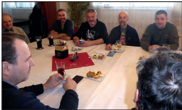
Výroční členská schůze včelařů, která se uskutečnila 16. února.

mi a se změnou přístupu Státní veterinární správy v odpovědnosti za zdraví včel. Došlo také ke změnám v dotační politice státu v neprospěch včelařů, Ministerstvo zemědělství významným způsobem omezilo poskytování finančních prostředků Českému svazu včelařů jako obecně prospěšné neziskové organizaci na propagační a osvětovou činnost, ústředí ČSV toto muselo řešit stopro-