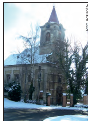
V první fázi opravy mšeckého kostela bude opraveno jeho průčelí a věž.

Ano, márnice by měla být opravena kompletně, včetně nové střechy. Libor Pošta