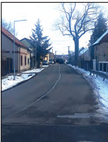
Kvůli řadě závad na zhotovené kanalizaci bude opět rozkopána i krajská silnice.