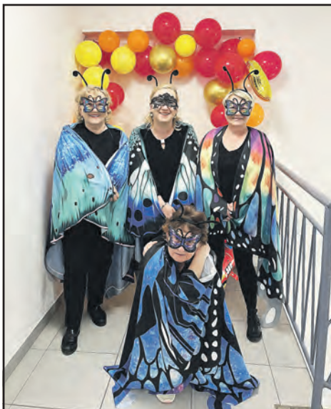
Motýli zářili všemi barvami.