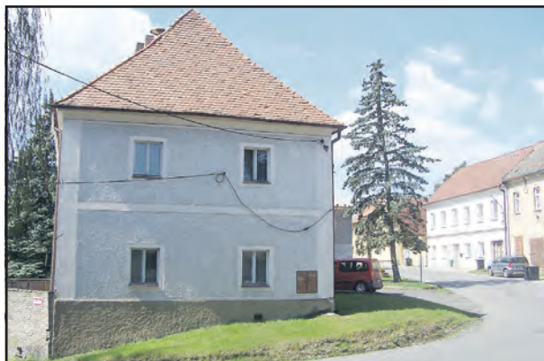
Renovat se bude dům úřadu městyse a budova bývalého zdravotního střediska (vpravo, vedle smrku).