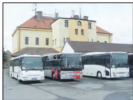
Kdy se na tomto místě místo autobusů objeví stavební stroje?

V PD jsme měli několik technických problémů, které odhalil až systém při jejich vkládání. Dále množství omezujících bodů, které vydaly jednotlivé instituce. Stavební úřad se snažil neztratit v nelehkém úkolu, a to v kombinaci omezení vlastníků sítí s návrhem stavby v PD. Některé sta-