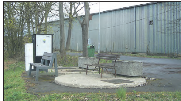
Čerpadla na této čerpačích stanici ucpávají vlhčené ubrusky.

Asi jsem to minule zakříkl, protože po době klidu nám opět vlhčené ubrusky komplikují provoz na hlavní čerpačích stanicích. Dokonce nám tam