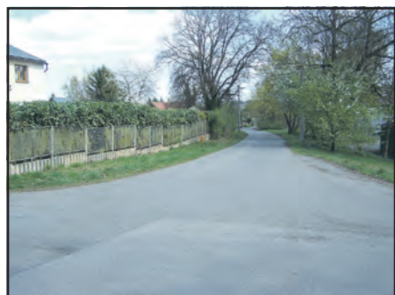
Výstavba nové kanalizace bude pokračovat v Hájecké ulici.

● V jaké ulici či ulicích byste chtěli ve výstavbě nové kanalizace pokračovat?