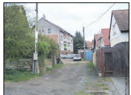
V této ulici bude vybudován nový vodovod.