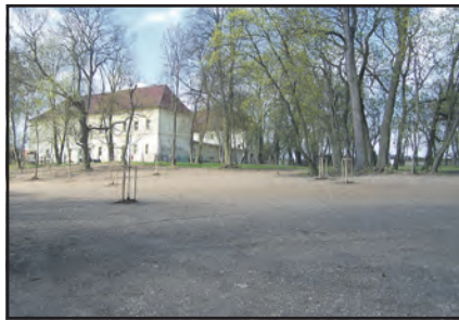
Takto dnes vypadá část parku, kde ještě nedávno stála zchátralá ubytovna pro česáče chmele.

Jedná se o dotační výzvu z Operačního programu Životní prostředí a Agentury ochrany přírody a krajiny ČR. Z této