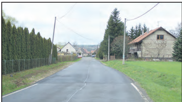
Starosta věří, že tento či jiný úsek ulice K rybárně nebude kvůli opravám kanalizace už nikdy rozkopán.

v dubnu doplaval i celý hadr na čerpadlo. Jak se tam dostal, je mytí podlahy a totálně ucpal velká záhada. Libor Pošta