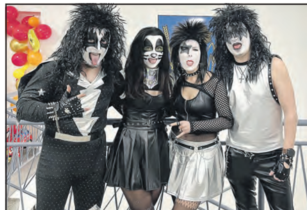
Kissáci patřili k nepřehlédnutelným maskám.