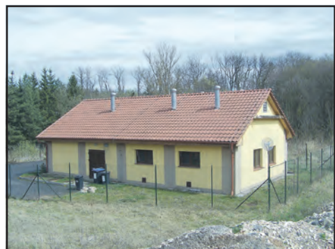
Fotovoltaická elektrárna by se měla objevit na střeše mšecké ČOV.

Podání nabídek bylo nastaveno na druhou polovinu dubna 2026 s relativně krátkou dobou plnění (v tomto roce).