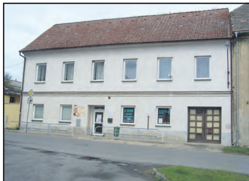
Nová fotovoltaická elektrárna bude instalována jak na střechu této budovy, tak i na střechu domu, v němž sídlí úřad městyse.

● Fotovoltaická elektrárna by měla být instalována