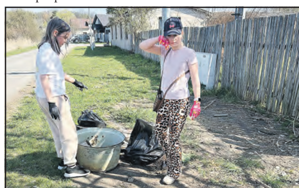
Jarní úklid ve Mšeci.