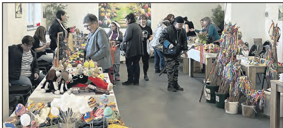
Stánky s výrobky na tradičním velikonočním jarmarku s návštěvníky i z okolí.

tikou. Malí návštěvníci si mohli vyzkoušet zdobení kraslic a odnést si vlastnoručně namramorovaná vejčička. Pro každého příchozího bylo navíc připraveno sladké občerstvení. -ÚM-