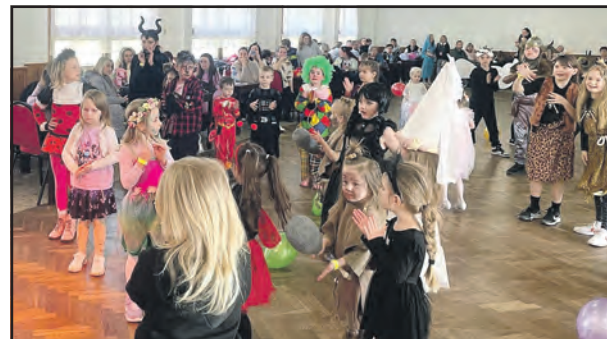
Dětský karneval v plném proudu.

Mšecké listy vydává Vydavatelství Gelton Nové Strašecí pro Městys Mšec. Vydavatel Jiří Červenka (tel. 313 572 113), šéfredaktor Libor Pošta (mobil 602 394 532), ilustrátor Ladislav Oplt, kreslíř Luděk Schneider. Adresa vydavatelství a redakce: Vydavatelství Gelton, Havlíčkova 1155, 271 01 Nové Strašecí, tel. 313 572 113, E-mail: gelton@gelton.cz, Web: www.gelton.cz. Sazba: Raport, s. r. o. Rakovník, Tisk: MAFRAPRINT Praha, Periodicita 1x za dva měsíce, Náklad: 5 000 ks, Cena: zdarma. Příspěvky do novin je možno odevzdávat na úřadě městyse Mšec čp. 109 nebo přímo ve vydavatelství Gelton.