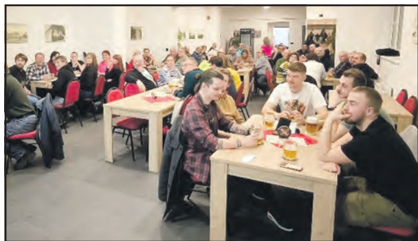
Mšecká hospodská vědomostní soutěž se pravidelně koná ve velkém salónku v restauraci Na Knížecí.