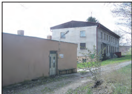
V těchto budovách by měly vzniknout obecní byty a i byty pro seniory s pečovatelskou službou.

Bude se jednat o kompletní rekonstrukci – fasáda, zateplení, okna, střecha, zdroj tepla, FVE, a určitě bude změněná i vnitřní