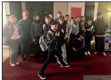
Žáci 7. třídy před sálem.

ZŠ Mšec plánuje podobné výjezdy i nadále, protože podle nadšených reakcí dětí se rozhodně vyplatí v nich pokračovat. Andrea Bejdová