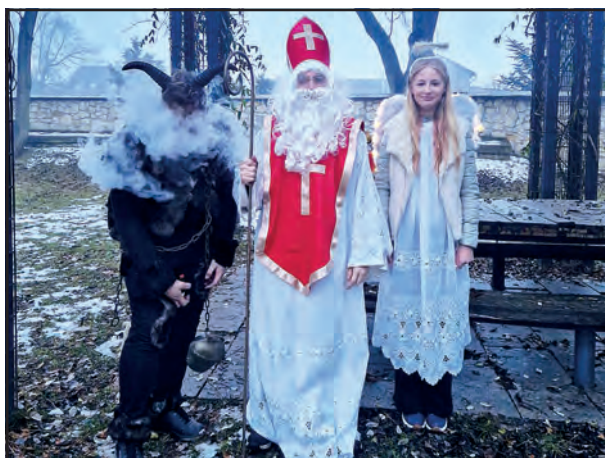
Čert, Mikuláš, a Anděl, kteří obdarovávali děti.

Během celé akce bylo zajištěno občerstvení a setkání tak zahájilo vánoční atmosféru.