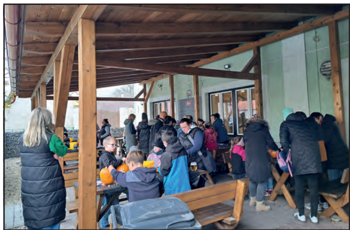
Účastníci mšeckého Dýňování vydlabávali dýně.