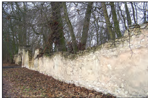
Zdi zámeckého parku budou postupně obnovovány.

Trošku nás zradilo počasí, kdy celý závěr podzimu pršelo, padala mlha, vše se lepilo,