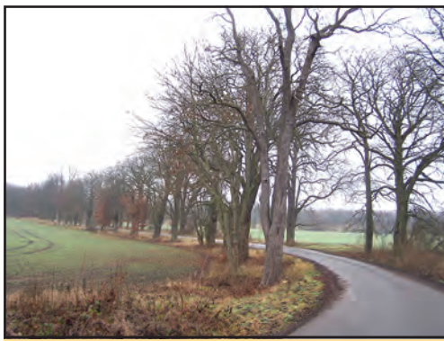
Vedení městyse hodlá obnovit i alej v Kaštance.

Pokračovat bychom chtěli dále ve Vítovské ulici, a i podél navazující cesty, klidně až k Pilskému rybníku. Určitě se zaměříme na alej za hřbitovem až na Třtickou silnici. Chtěli bychom postupně obnovit i alej v celé Kaštance, nebo také z Hájů směrem na Martince. Obnovovat původní aleje a vracet stromy podél cest je pro místní krajinu a lidi v ní žijící velmi důležité. Libor Pošta