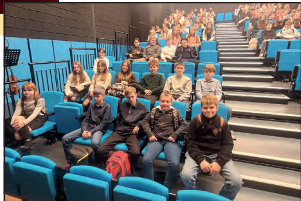
Žáci ZŠ Mšec v Karlínském divadle.

Co na výlet říkají děti ze 6. A? „Bylo to super, jela bych klidně znovu,“ uvedla Inka při odchodu z divadla. „Líbilo se mi,