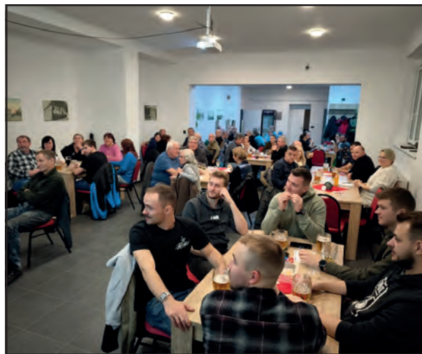
Pohled na soutěžící do části salónku restaurace Na Knížecí.

poslední kolo rozhodlo o tom, že o pouhopouhého 0,5 bodu vyhraje tým „Tuřaňáci“, který tak obhájil vítězství z minulého kola. Na druhém místě se umístili Patláci a třetí místo obsadily