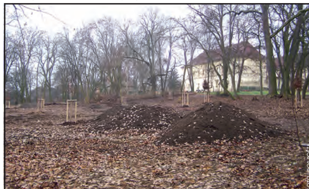
Tyto hromady ornice budou v době vydání těchto novin možná již minulostí.

hledné době ještě nějaké další zásahy do stávající zeleně? Určitě se bude jednat o kont-