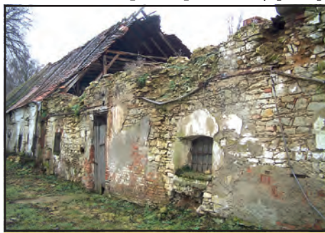
Bude tato zed' zbourána zcela nebo jen částečně?

● Určitě byste se měl řídit i tím, co Vám doporučí pan