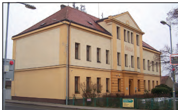
Základní škola ve Mšeci.

„Inspekční zpráva“ uvádí: Škole se daří efektivně organizovat školské služby díky promyšlené, funkční a osvědčené organizační struktuře. Vnitřní informační systém je funkční, příkladně je nastavena spolupráce ředitele a učitelů ZŠ k jejich dalšímu kompetenčnímu