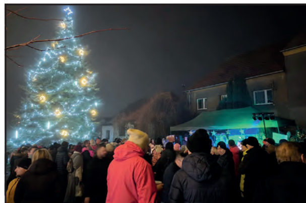
Rozsvícení vánočního stromu o první adventní neděli.