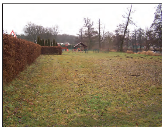
Zde by mělo vzniknout nové workoutové hřiště.

● Jak chcete stavbu realizovat, a kdy by mohla být