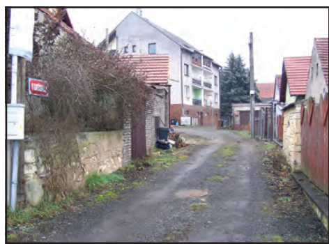
V tomto roce by měl být zhotoven také nový vodovod v ulici V Kateřinkách.

Určitě to jsou rekonstrukce budov úřadu a bývalého zdravotního střediska.