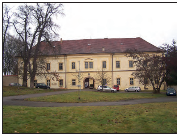
Kdy budou v tomto velkém objektu akumulční kamna vyměněna za tepelná čerpadla?

● V současné době má vedení městyse zpracován energetický posudek, a nyní je to účel někoho oslovili, a máte pro něj připravené všechny potřebné podklady?