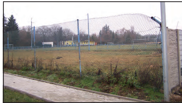
Fotbalové hřiště je „hlídáno“ kamerovým systémem.

hypoteticky vydrží v horších podmínkách a stárne pomaleji. Námí vybrané řešení, které se stále rozšiřuje, má dlouhou dobu podpory a doposud minimální potřebu servisu. Systém je decentralizovaný, takže jednotlivé větve bude po čase nut-