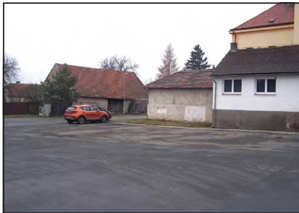
Kdy se na tomto místě začne „rodit“ nové víceúčelové hřiště?

Nejdlejší hledání společné cesty bylo asi právě u ČEZu. Jedná se asi o největší instituci z oslovených, kde jsou hodno-