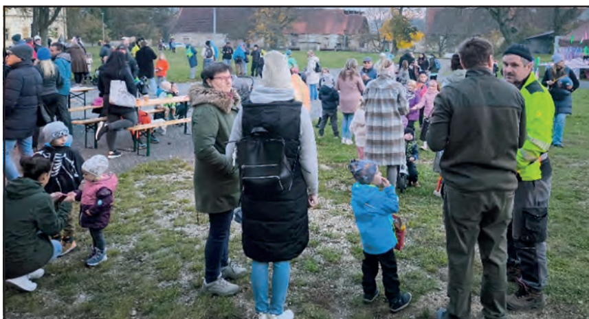
Dětské soutěžní odpoledne.

Odpoledne začalo zábavnými soutěžemi, při nichž děti získávaly strašidelné sladkosti jako odměny. Pak se děti s lampiony vydaly na stezku a na závěr si všichni užili opékání buřtů.