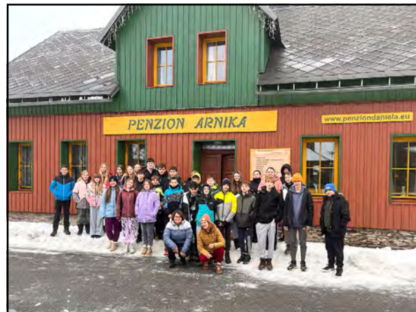
Penzion Arnika a lyžaři.

My, „dospěláci“, máme veličanskou radost! Růžová a žlutá „kuřátka“ sedí v pořádku a bez úrazů v autobuse. „Lyžák“ spl-