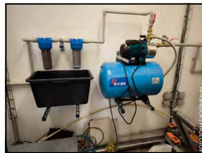
Nové přídavné zařízení v objektu ČOV.

Čerpadla se snaží obsluhu čistit pravidelně a předchá-