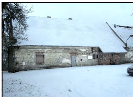
V tomto domě na nádvoří mšeckého zámku vzniknou nové obecní byty.