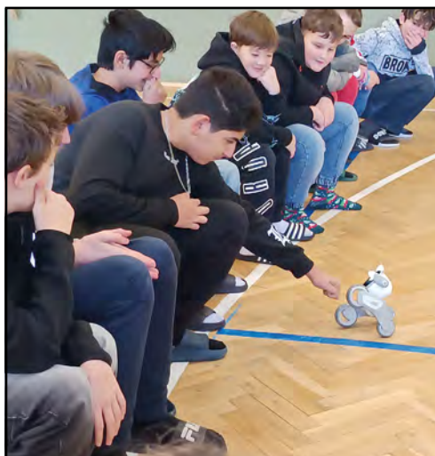
Žáci 7.třídy v tělocvičně s robotem.