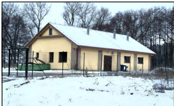
Mšecká ČOV funguje bez problémů.

ČOV obsluhuje od začátku Tomáš Loskot, společně se snažíme udržovat ČOV ve funkčním stavu a stále pracujeme na vylepšování. Libor Pošta