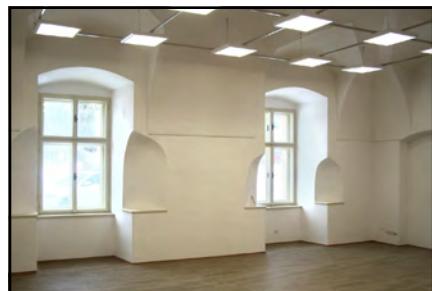
V největší zrekonstruované místnosti bylo již položeno i lino.

sdělit, co všechno je v nich hotovo, co se zde nyní, na začátku února, dělá, a co ještě zbývá k dokončení?