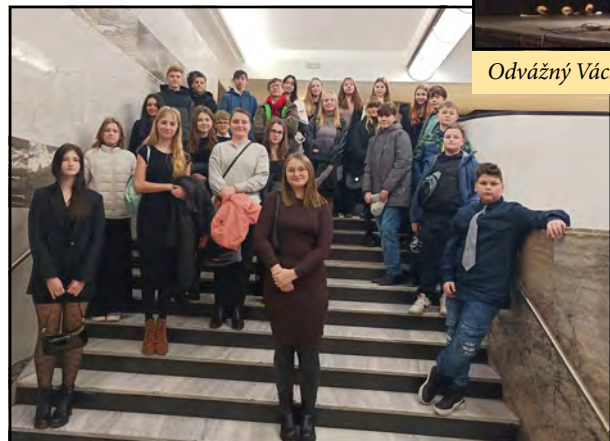
Žáci ZŠ Mšec v divadle Komédie.