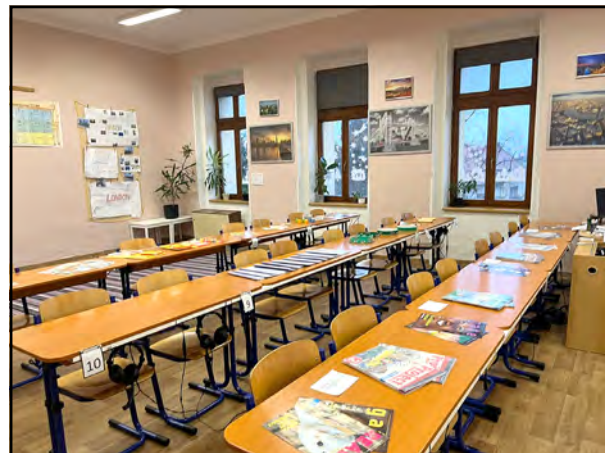
Učebna anglického jazyka.