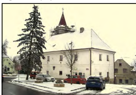
V dubnu může být na této budově již lešení.

● Kdy by mohly být stavební práce zahájeny?