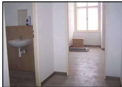
Nové sociální zařízení s technickou místností.

ném stavu. Nepočítali jsme také s rekonstrukcí velké chodby, ale nemůžeme přeci nechat vstupní