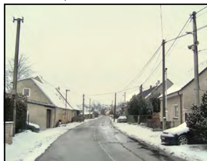
Kdy z ulice K rybně zmizí tyto „nádherné“ sloupy?

trubiček jsou vždy nejdražší výkopové práce. Proto se většinou pokládají při nějaké rekonstrukci či výstavbě. Bude tomu tak asi i ve Mšeci, při realizaci bude firmě Cetin nabídnuto