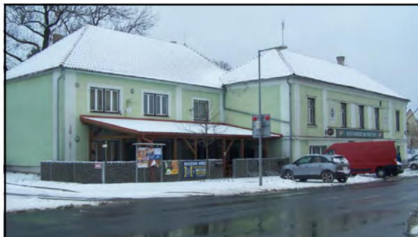
Restauraci Na Knížecí mšecí obyvatelé moc nenavštěvují.