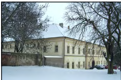
Vytápění mšeckého zámku by mělo být po instalaci nového topného systému podstatně levnější.