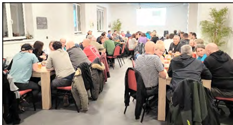
Soutěžící již dovedou zaplnit celý velký salónek.

Kolektivní demence (15,5 b) a 10. Démoni (11 b). Poprvé se tak stalo, že tým Tuřaňáků, který do té doby vyhrál všechny čtyři úvodní kola, neobhájil první místo a skončil až na šestém místě o dva body za vítěznými Kopretinami.