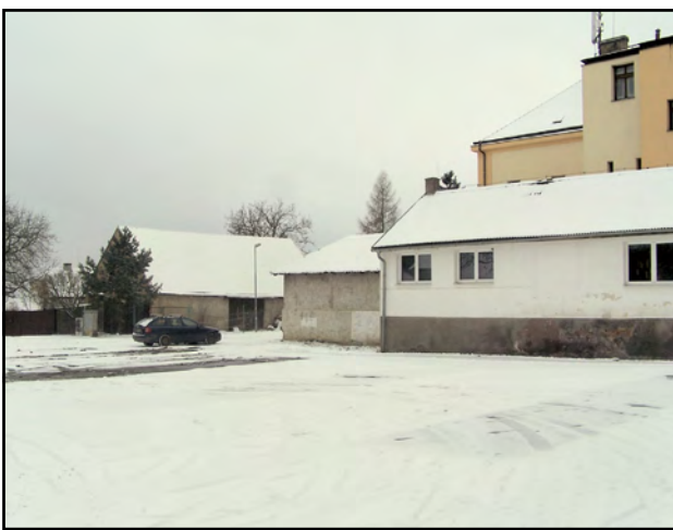
Kdy se na tomto místě rozběhnou stavební práce?

Doplnění žádosti pro stavební úřad proběhlo na začátku roku. Stavební úřad je aktuálně velmi vytížen změnami v katastru, které stále pro-