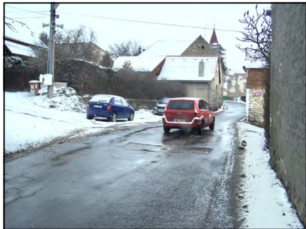
Propadlá „záplata“ v Salačově ulici, v místě, kde do této ulice ústí ulice Trubačova a U lípy.

až do samého závěru podzimu, což nebylo úplně komfortní. Co se týče zbytku povrchu na krajské silnici, místa se objevují propadlá místa