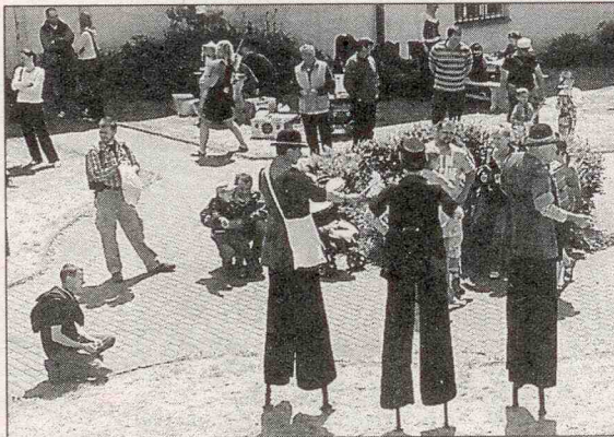
Vystoupení kapely na chůdách