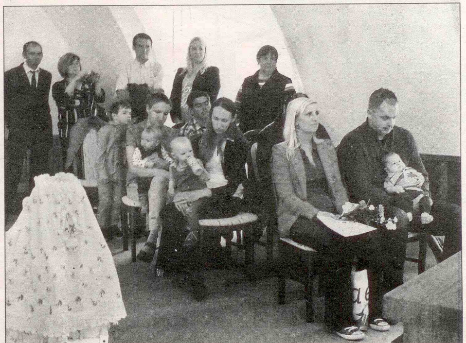
Vítání občánků 2014