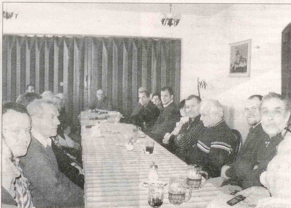
Včeláři – ZO ve Mšeci