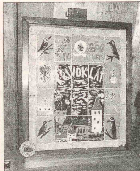
Vítězná práce žáků ZŠ Mšec