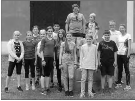
Žáci na cykloúletě

Obloha bez mráčku, příjemná teplota a nadšené očekávání 15 účastníků ze sedmé, osmé a deváté třídy zahájilo náš první školní cyklistický kurz. V pondělí 22. května jsme po menších logistických problémech naskládali kola do dodávky, my jsem naskákali do autobusu a vyrazili směr Rakovník, kde na nás čekalo dalších 24 bikerů z 1. základní školy. Společně jsme pak po vlastní