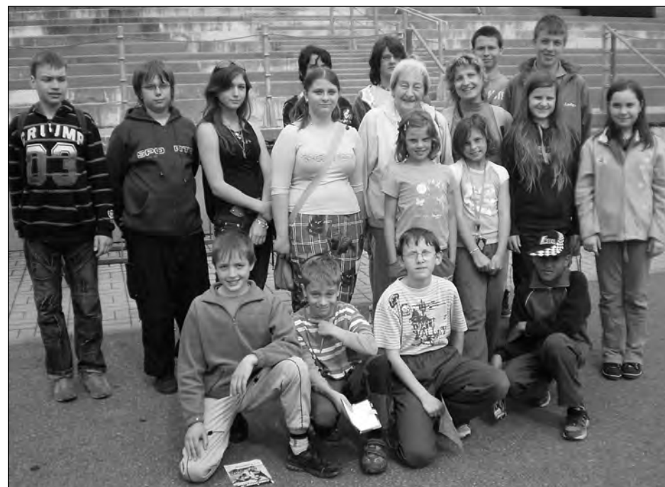
Sportovní exkurze – žáci 8. třídy na stadionu v Kladně