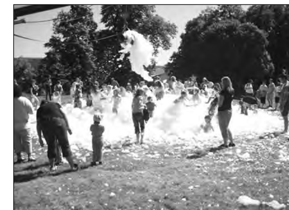
Pěnová párty na dětském dni

V sobotu 5. června se konal pod kulturním zařízením ve Mšeci dětský den. Letos jsme pro děti připravili sportovní soutěže, pěnovou párty a opékání buřtů. Nejprve děti dostaly soutěžní kartičky, do kterých získávaly razítka za splnění úkolů v jednotlivých sportovních soutěžích. Soutěžilo se v kuželkách, házení míčků do klauna, prolézání tunelem, přenášení míčku na lžičce, chození na dětských chůdách a pře-