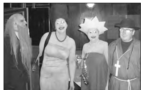
Jedny z nejlepších masek