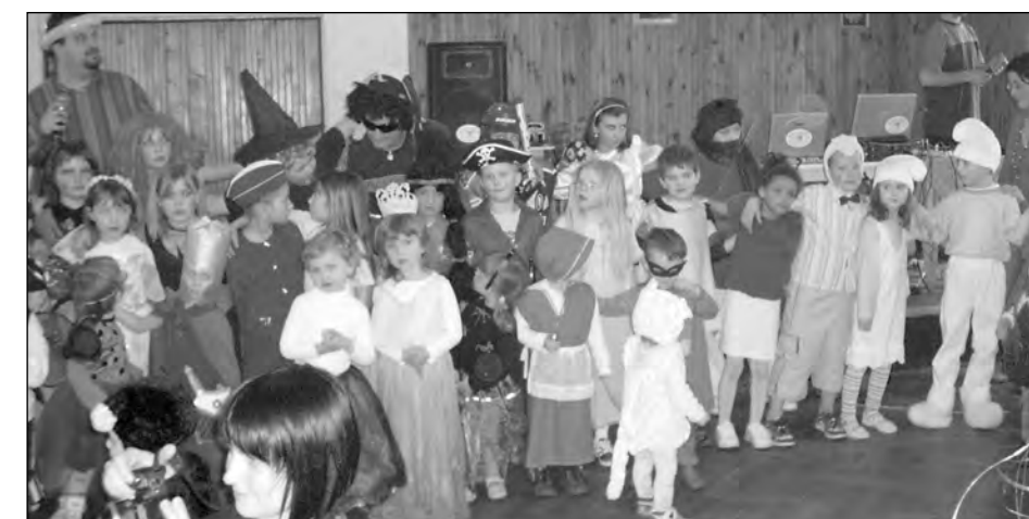
Letošní maškarní karneval navštívilo mnoho zajímavých masek