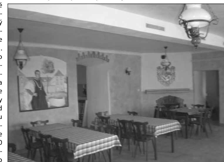
Restaurace Na Knížecí připravena k otevření

Lokality: část obce Měsč: ulice nad česáčkou + pravá strana ulice od školy směr Slaný, v areálu zámeckého parku, moštárna, dílna truhlářství, kuchyně ZD, AGRO, ubytovny ZD, kulturní dům a škola v objektu zámku, spodní část obce od zatáčky pod kostelem včetně postranních ulic, statku, ulice ke hřbitovu a pravá strana ulice k rybníku.