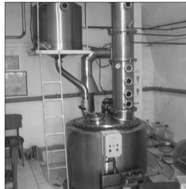
Pohled na destilační zařízení