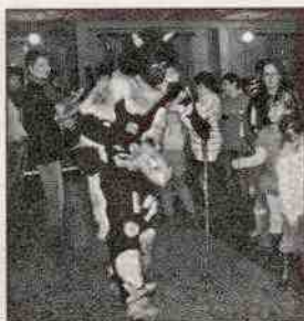
Čert rozdávající balíčky dětem

Mikuláš a čert. I tady neponechali nic náhodě a děti si postupně k sobě zvali v několika věkových kategoriích a dle věku chtěli od dětí buď zazpívat písničku a nebo zrecitovat básničku. Svému se nevyhnula ani věková kategorie 10 – 13 let, tady už děti musely předvést svůj um v počítání nebo ve vyjmenovaných slovech. Nakonec se dostalo na všech 53 dětí, které si spokojeně odnášely svoji odměnu ve formě balíčku plného cukrovinek a ovoce. Děkujeme všem, kteří se akce zúčastnili, i těm kteří nám s pořádání akcí pomáhali. Starostka