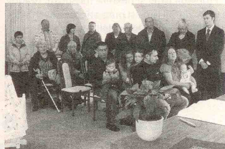
Letošní vítání občánků