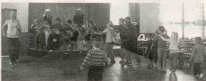
Jede jede mašinka

malování na obličej, zahráli si pohádku a jiné. Děti měly během celého odpoledne tradičně limonádu a buřty zdarma. I když se nás tentokrát nesešlo mnoho, doufáme, že příští dětská akce se vydaří lépe. ÚM