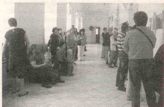
Návštěvníci letošní prohlídky zámku

Rudy a Nového Strašecí, téměř baletním vystoupením děvčat z tanečního kroužku Základní školy ve Mšeci, velký potlesk sklidilo svěží taneční vystoupení členů historického