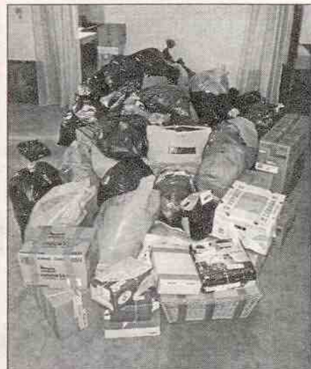
Shromážděné věci pro Občanské sdružení Diakonie Broumov

Před úřadem Městyse Mšec všichni společně rozsvítíme vánoční strom. Děti ze zdejší základní a mateřské školy budou mít pro Vás připravený kulturní program, dále zde budou stánky s vánočními výrobky, svařeným vínem a cukrovím. ÚM