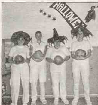
Halloween ve školní jídelně

Letos jsme si povídali o tom, jak probíhá typický dětský halloweenský večírek a došlo i na strašidelný příběh. Vůbec poprvé se zapojily i naše kuchařky se zeleno-oranžovo-žlutým obědovým menu podávaným v jídelně vyzdobené dýněmi, netopýry, pavouky a duchy. Děti zřejmě nejvíc ocenily čarodějnický převlek všech dam z kuchyně. Vyvrcholením celého dne byl bezesporu lampionový průvod, který probíhal ve strašidelné mlze. Problikávala jen řada světýlek lampionů táhnoucích se Mšeci po trase vyznačené svíčkami. Obdiv zaslouží trpělivá čarodějnice, která musela vyslechnout mnoho a mnoho (často se opakujících) básniček dárků chtivých malých i větších dětí. Kdo našel odvahu a prošel zámeckým parkem,