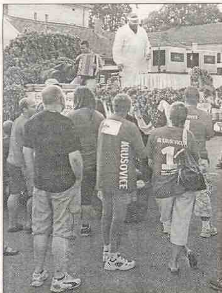
Pojízdny výčep krušovických sládků ve Mšeci

V pátek dne 2. září 2011 byl realizován letos již 2. ročník spanilých jízd Pojízdného výčepu krušovických sládků. Po předešlých návštěvách okolních obcí dorazil výčep okolo 18 hod. do naší obce. Před kulturním zařízením čepovali dva výčepní mistři zdarma krušovické pivo. Přítomní měli možnost si zasoutěžit v Krušovickém trojboji nebo posedět u piva. S pojízdným výčepem přijel moderátor, harmonikář a fotograf. Dále celá tato akce pokračovala od 20:00 hodin v kulturním zařízení taneční zábavou. K tanci a poslechu hráli hudební skupiny Cocktail a Kapišto. V tombole se losovalo o sud dvanáctky a sud desítky, dále o trička, piva, čepice a další. Taneční zábava navštívilo kolem 70 lidí. ÚM