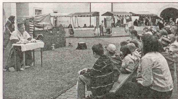
Pohádka O Kulfáčkovi

Rakovnický deník + OÚ Mšec Více fotografií na www.obecmsec.cz