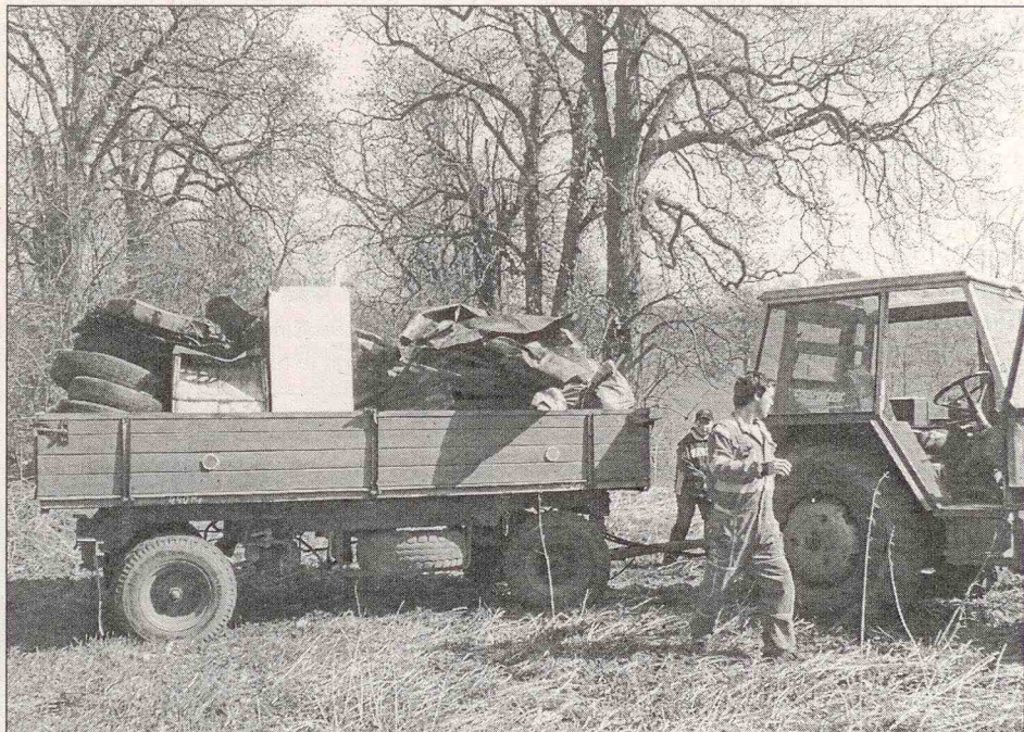
Odpad sebraný v části kaštánky

Zdravíme všechny příznivce MŠECKÉHO KOLEČKA 2011. Letošní kolečko bychom chtěli odstartovat v neděli 22. května. Případné zájemce žádáme o přihlášení, a to do 11. května 2011. Startovné činí 50,- Kč. Každý účastník obdrží tričko s logem. Přihlásit se můžete na Úřadě městysu Mšec nebo na tel. č. 731 473 041. Doufáme, že se letos sejdeme a tento výlet budeme moci uskutečnit.