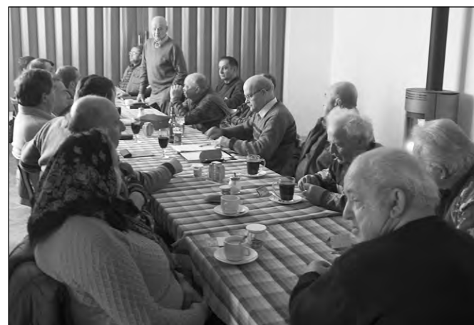
Výroční schůze včelařů