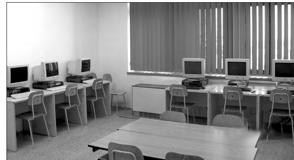
Počítačová učebna ZŠ Mšec. Článek „Co se děje ve škole?“ najdete na straně 4.