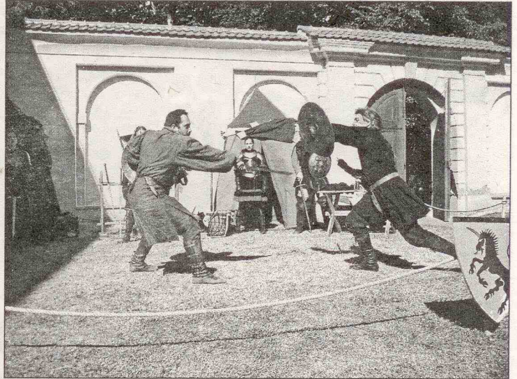
Vystoupení šermířů na mšeckých slavnostech

Těšíme se na shledanou příští rok! ZŠ a MŠ Mšec a Městys Mšec