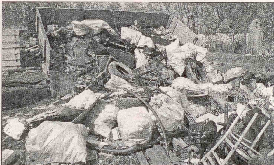
Výsledek černých skládek z okolí Mšece

Závěrem bych chtěla všem, kteří se akce zúčastnili, moc poděkovat a přála bych si, aby jsme příští rok nemuseli vůbec uklid černých skládek vyhlášovat a setkali se radši u nějaké lepší příležitosti. Děti i dospěláci, nezapomeňte si vyzvednout svoji odměnu na pálení čarodějnic! Fota si můžete prohlédnout na: www.obecmsec.cz Starostka