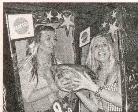
Vítězné masky letošního karnevalu

Chtěli bychom touto cestou poděkovat všem, kteří se na pořádání těchto akcí podíleli, zejména děkujeme paní Růženě Horákové za upečení dortů, které byly jako ceny pro masky. ÚM