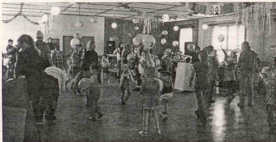
Balónková show na dětském maškarním karnevalu

Pokud bychom omylem na někoho zapomněli, dejte nám to, prosím, vědět na Úřad městyse Mšec. Těšíme se na Vás i na Vaše nejmenší. ÚM