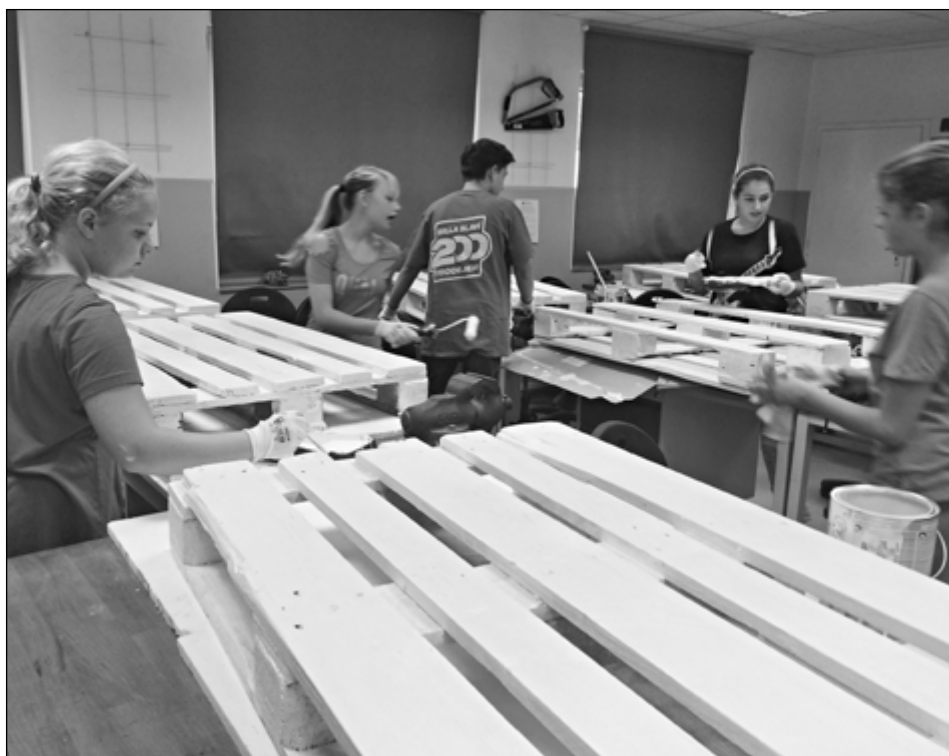
Žáci vyrábějí lavičky