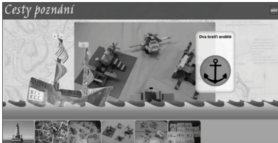
Ukázka z projektového webu Objevitelské cesty v oceánu sloo aneb kniha jako kompas

Nelze si nevšimnout, že se mšecká škola oblékla do nového (krásného) kabátu. Za tento počín patří dík všem, kteří se o to zasloužili – především vedení obce v čele s paní starostkou. Budova školy v létě oslavila 124. narozeniny, takže si takový dar bezpochyby zasloužila.