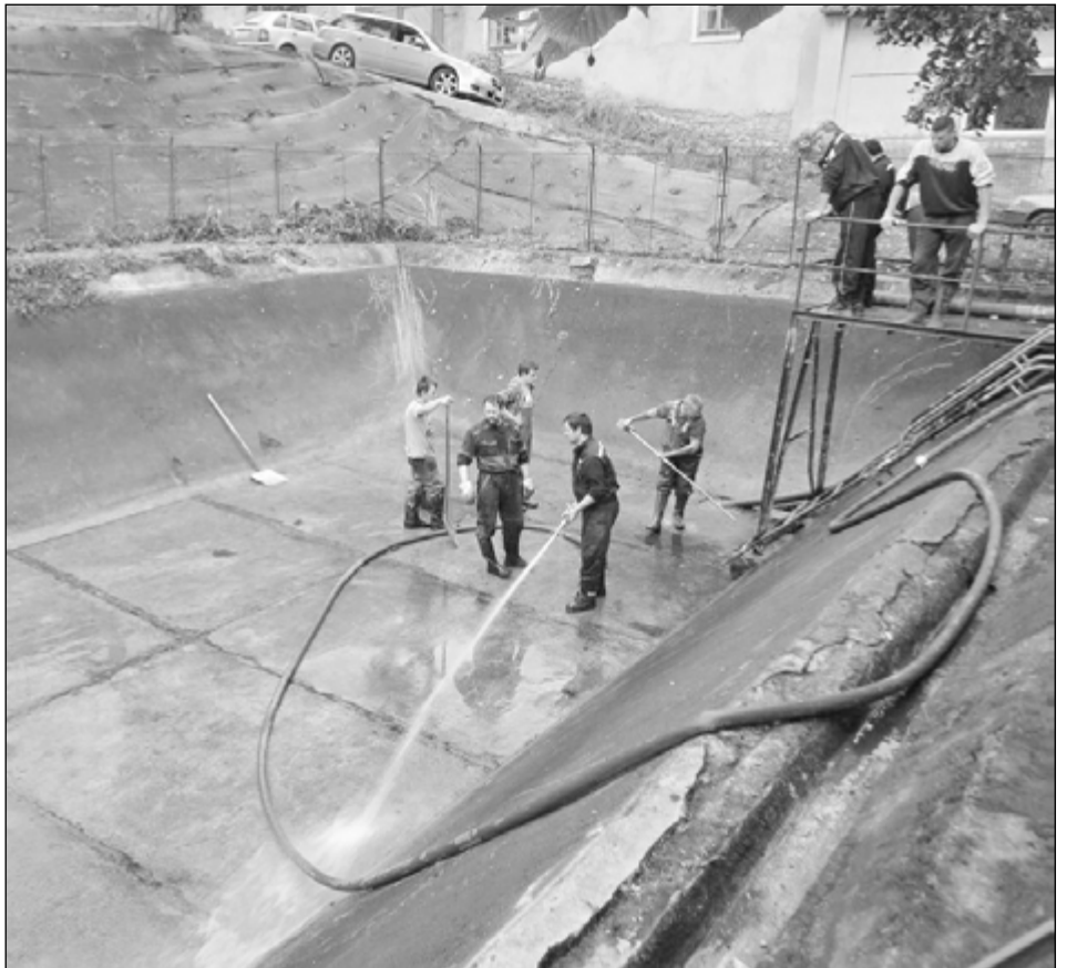
Čištění požární nádrže

ktej je kolem dokola. Označuje se i jako hasičská nádržka, z které je možnost čerpat vodu při nedej bůh požáru v jejím okolí. Má stálý přítok pramenitě čiré vody, která byla podle místních občanů dříve