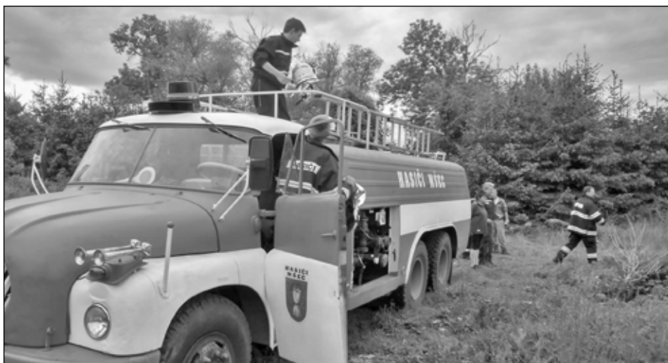
SDH Mšec.

Poslední dobou zaznívá tahle otázka často a veřejně a tak Vám, vážení a milí občané Městysse Mšec odpovíme.