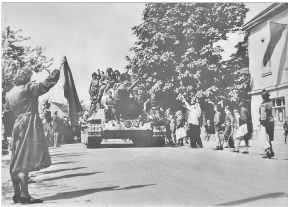
3 – 9. května 1945 - tank Rudé armády projíždějící Mšeci směrem na Slaný